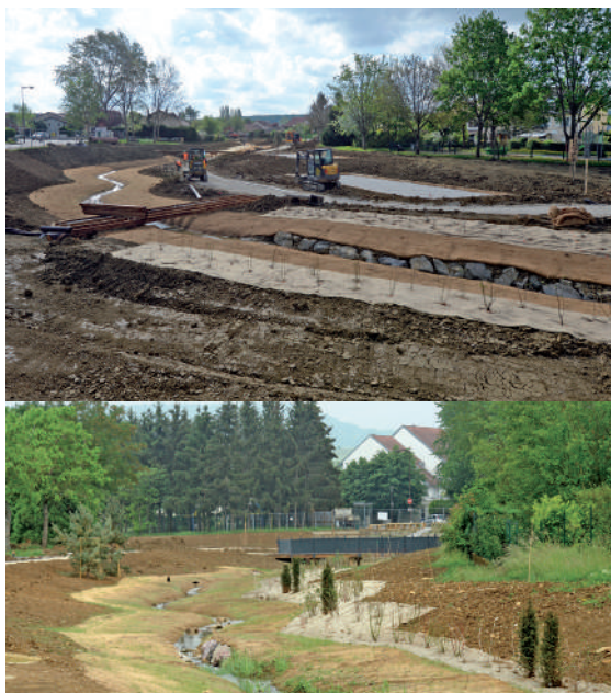
Le ruisseau du Grémillon dans la traversée du parc de Pulnoy (aménagement d'un lit majeur, re-méandrage et renaturation des berges).

https://uicn.fr/wp-content/uploads/2020/01/SfN-light-ok.pdf