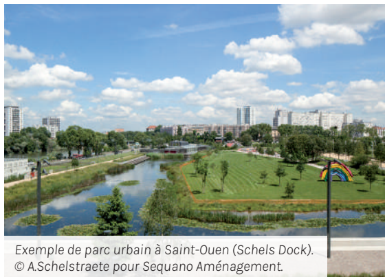
Exemple de parc urbain à Saint-Ouen (Schels Dock).

Si certains territoires se sont développés en tenant compte de ce principe, notamment en Seine-Saint-Denis ou dans les Hauts-de-Seine depuis plusieurs années par exemple, la plupart des opérations actuelles l'introduisent dans leur cahier des charges, en visant la gestion des eaux pluviales à travers des procédés plus naturels.