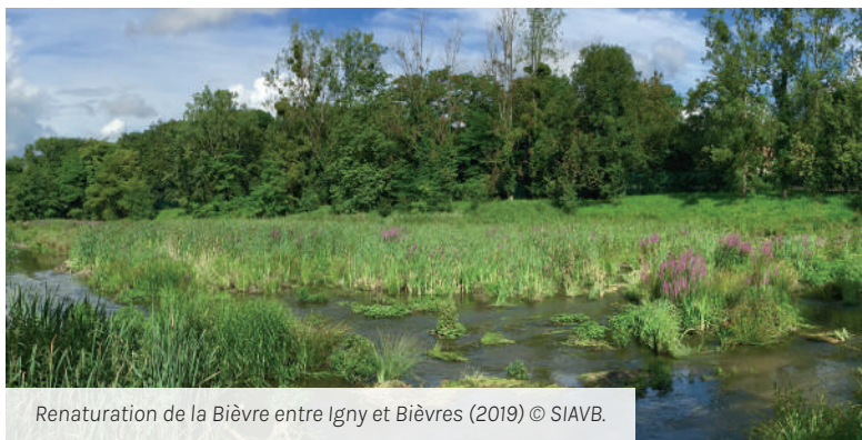
Renaturation de la Bièvre entre Igny et Bièvres (2019)

https://uicn.fr/wp-content/uploads/2020/01/SfNlight-ok.pdf