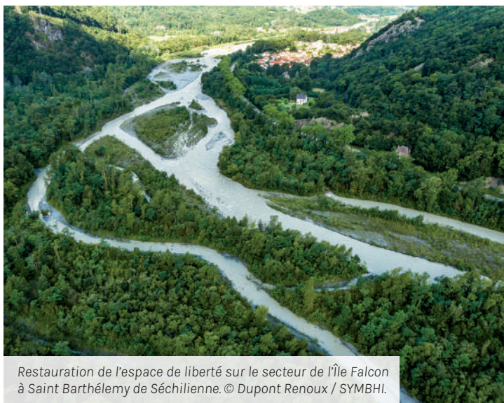
Restauration de l'espace de liberté sur le secteur de l'Île Falcon à Saint Barthélemy de Séchilienne.

https://symbhi.fr/nos-territoires/la-romanche/romanche-sechilienne-des-travaux-dans-la-plaine-de-vizille/