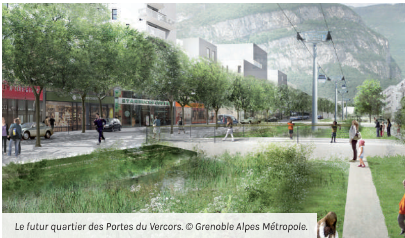
Le futur quartier des Portes du Vercors.

Pour en savoir plus : https://metropoleparticipative.fr/35-les-portes-du-vercors.htm