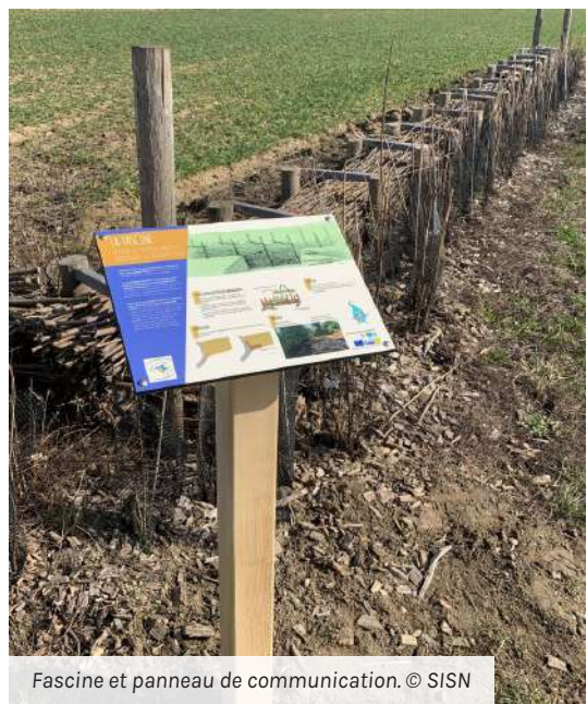
Fascine et panneau de communication.