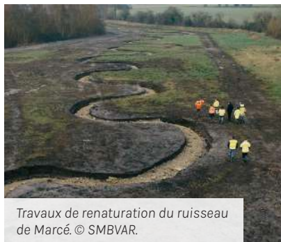
Travaux de renaturation du ruisseau de Marcé.

https://www.smbvar.fr/actualites/fin-des-travaux-de-renaturation-du-ruisseau-de-marce