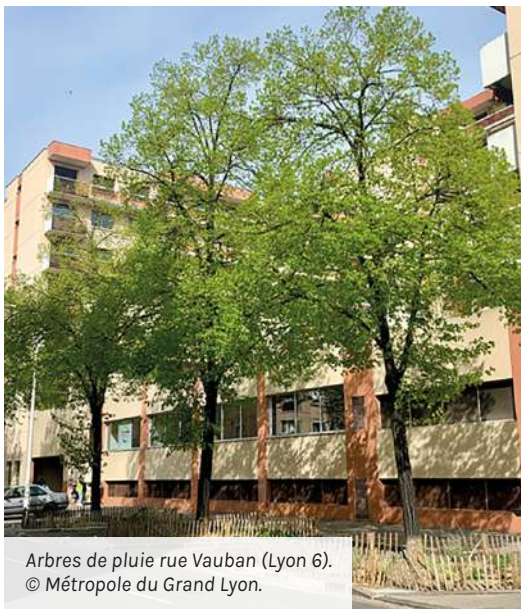
Arbres de pluie rue Vauban (Lyon 6).

https://www.ofb.gouv.fr/sites/default/files/2022-12/livret_arbre_de_pluie_web.pdf