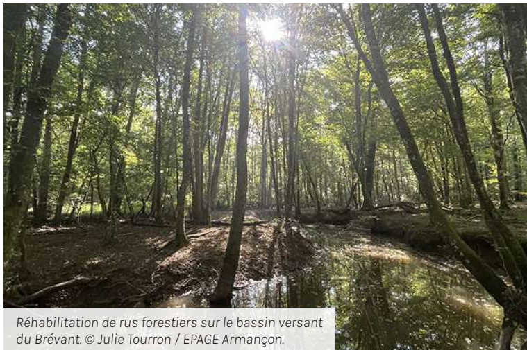
Réhabilitation de rus forestiers sur le bassin versant du Brévant.