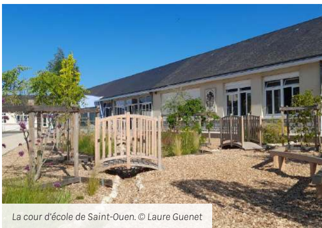
La cour d'école de Saint-Ouen.

https://www.caue41.fr/actualites/retour-sur-la-visite-de-la-nouvelle-cour-decole-de-saint-ouen/