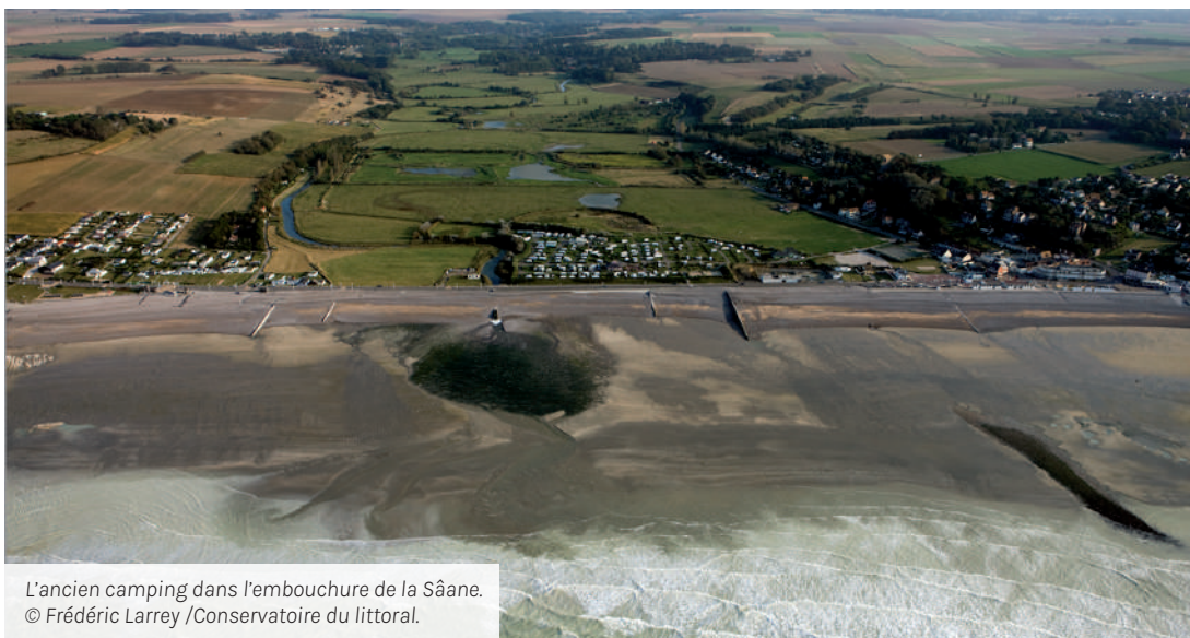
L'ancien camping dans l'embouchure de la Sâane.

Sur ce site, la question foncière est l'une des clés pour atténuer les risques et envisager la recomposition spatiale, dans l'optique de s'adapter au changement climatique et de redonner plus de place à la nature (zone humide et reconnexion de la rivière à la mer).