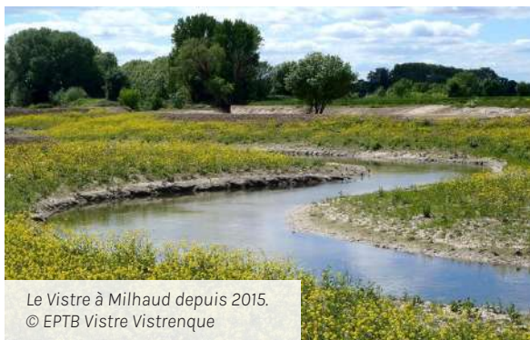
Le Vistre à Milhaud depuis 2015.

https://vistre-vistrenque.fr/revitalisation/pourquoi-revitaliser-nos-rivieres/la-revitalisation-quesaco/