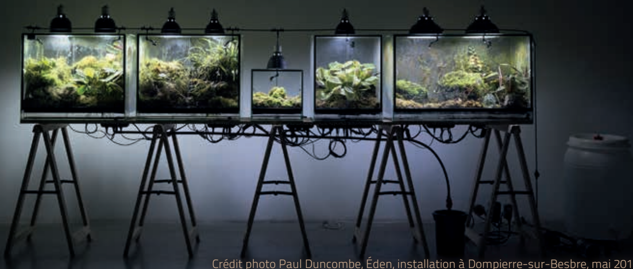
Éden, installation à Dompierre-sur-Besbre, mai 2017. Projet soutenu par l'Association As'Art, la ville de Dompierre-sur-Besbre, le département Allier, le ministère de la culture et de la communication : DRAC Auvergne Rhône-Alpes Des ensembles de plantes sont abandonnés dans des serres contenant des éléments radioactifs. Avec le temps, de naissances en pourrissements, un chaos de verdure se propage derrière les parois vitrées du dispositif.

As'Art elkarteak, Dompierre-sur-Besbre herriak, Allier departamenduak, Kultura eta komunikazio ministerioak: DRAC Auvergne Rhône-Alpes-ek babesturiko egitasmoa. Landare multzoak gai erradioaktiboak aterpetzen dituzten negutegitan utziak dira. Denborarekin, sortuz eta ustelduz, berdura kaosa garatzen doa dispositiboaren berinen atzean.