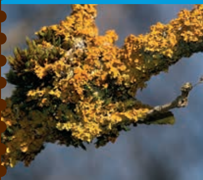
Xanthoria parietina