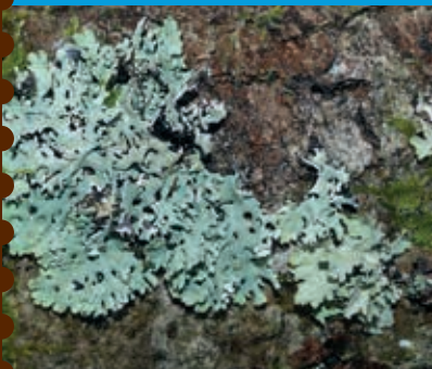
Hypogymnia physodes